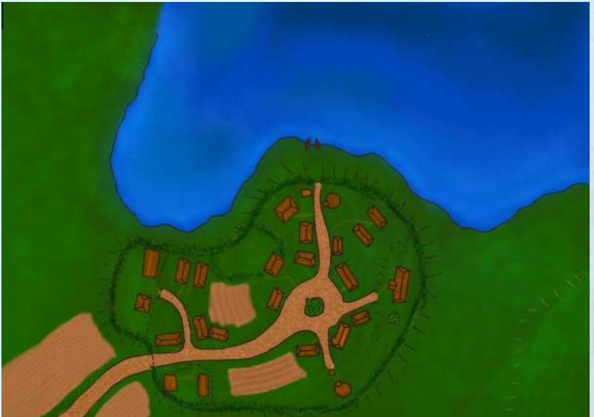
Skizze: Das Dorf

Dieses kleine Szenario spiegelt das Leben in einen Dorf wieder und stellt die verschiedenen Bewohner vor. Das Dorf passt gut irgendwo in Dragorea hinein, besonders in Tir Durghachan kann aber einfach an irgendeine Stelle von Lorakis gesetzt, benannt und angepasst werden.